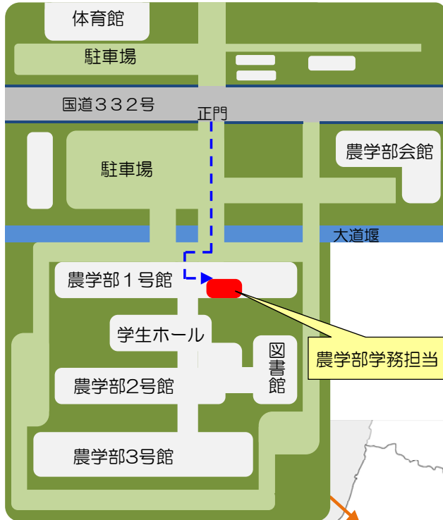
◎鶴岡キャンパス(鶴岡市若葉町1-23)