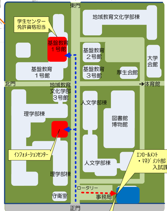
◎小白川キャンパス(山形市小白川一丁目4-12)