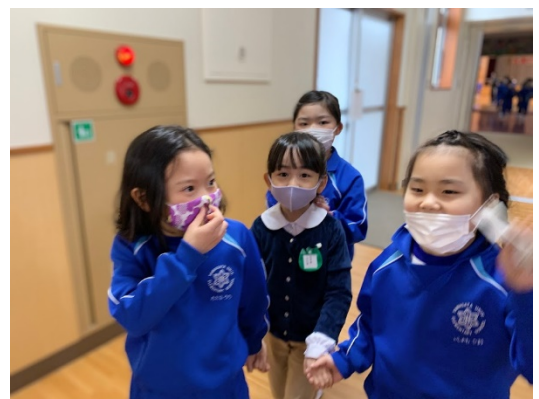
学校探検をして、校内を案内する児童