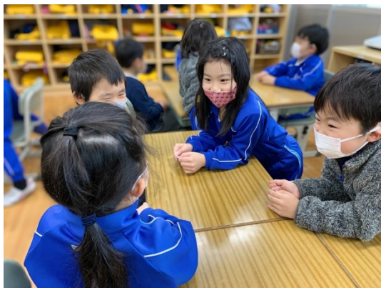
お互いに自己紹介する場面

この交流で初めて幼稚園児と対面することができるということで、子どもたちはどんなことをすると、園児が小学校を楽しみにしてくれるようになるか意識して活動内容を考えることができた。当日は朝から緊張し、会えるのを楽しみにしていた。実際の交流では、園児に優しく声をかけるなど、これまで自分たちがしてもらった経験を生かして、園児とかかわることができていた。