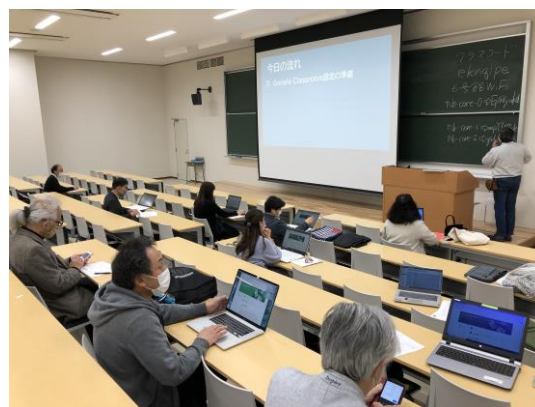
写真：「オンライン授業に関する研修会」の様子

講演：『地学・教職・学職一体の大学改革～共愛学園前橋国際大学の取組～』、講師：大森昭生氏・共愛学園前橋国際大学学長（開催日：令和2年9月15日）、「学生による授業改善アンケートの評価優秀者による授業概要、工夫等の紹介」（開催日：令和3年1月15日）、「学内研究奨励賞受賞者による研究発表」及び「教育改革推進研究奨励賞による研究発表」（開催予定日：令和2年2月19日）を行った。なお、今年度は遠隔授業への対応として「オンライン授業に関する研修会」（開催日：令和2年11月20日）を企画し、各学科でもFD委員が中心となってオンライン講習会を行った。