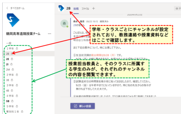
図1. Teamsを用いた遠隔授業プラットフォーム

本校における遠隔授業のメインプラットフォームとして、マイクロソフト社のTeamsを採用した。各クラスのプ