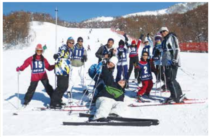
日本・台湾の大学生によるスポーツ交流プログラム(山形市蔵王)