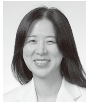
由布院玉の湯社長

大河ドラマ「天地人」脚本家。1990年にドラマ「卒業」で脚本家デビュー。「若葉のころ」「青の時代」「Summer Snow」が青春3部作として好評を博す。以降、「セカンド・チャンス」「ガッコの先生」「元カレ」「バツ彼」「ブラザー☆ビート」「おいしいプロポーズ」「花嫁のれん」などを手掛ける。NHKでは、連続テレビ小説「どんと晴れ」などを執筆。