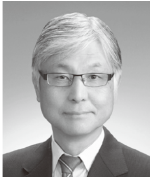
首都大学東京教授 (前観光庁長官)