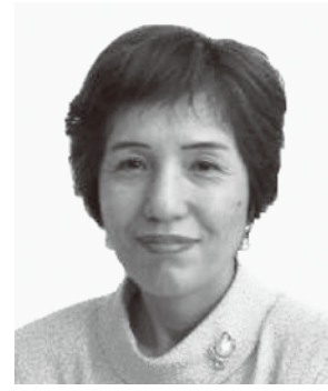
元山形県副知事 (現・鉄道・運輸機構理事)

大分県湯布院町生まれ。大学卒業後、家業の宿「由布院玉の湯」の専務取締役を経て、03年10月より代表取締役社長。旅館業のかたわら、町づくりなど市民グループの代表や世話人を務める。他に社団法人ツーリズムおおいだ副会長、由布院温泉観光協会会長などを兼任。