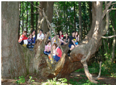
図1 学生の体験型授業

教育においては、本学独自の取り組みである自然や地域社会を活用したフィールド活動・体験型授業（図1）を展開し、学生の課題発見能力・コミュニケーション能力等の涵養に努め、学生アンケートにおける高い評価を通じて、その成果を確認した。また、学生アンケートの結果を活用したFDセミナー等を開催し、授業内容や教育方法等の質の向上に努めた。さらに、キャリア教育の充実、学長及び理事による企業訪問や地元企業と連携した企業向け研修会等を始めとする就職支援（図2）を通じて、学部及び大学院とも、前年度を上回る就職率を確保できた。