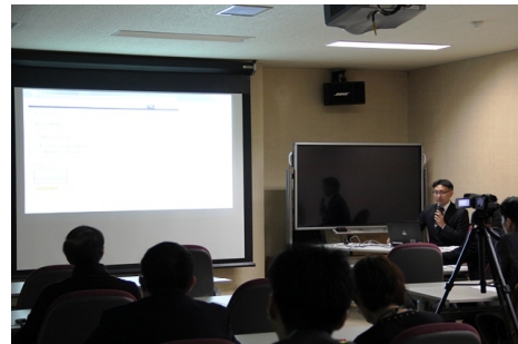
図10 論文剽窃ツールの操作説明会

以下に、教育研究等の質の向上の状況及び業務運営・財務内容等の状況について、項目ごとに説明する。