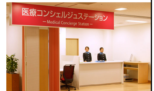
図6 医療コンシェルジュステーション