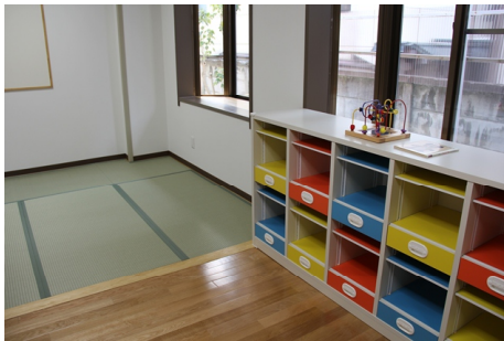
図9 開所後の保育所

その他の取り組みとしては、教職員のワークライフバランスを充実するとともに、学生が保育や幼児について学び研究する場を提供するための施設として平成26年3月に開所式を行った保育所「のびのび」（図9）の入所希望者の受入れを開始した。また、博士学位論文の審査をより適切に行うとともに、研究活動における不正行為を未然に防ぐことを目的に論文剽窃チェックツール「iThenticate」を平成26年11月に導入し、操作説明会を開催するなどした（図10）。