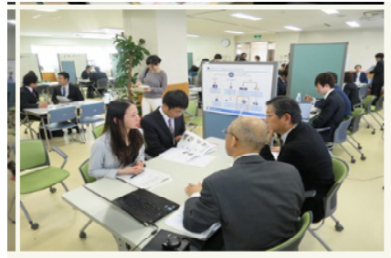
図2 学内開催の企業説明会

研究においては、YU-COE（山形大学先進的研究拠点）をはじめとする大学独自の各種支援策を通じて、先進的研究、基礎的研究及び地域に根ざした研究を推進した。有機材料に関する研究については、トムソン・ロイター社から材料科学（Material