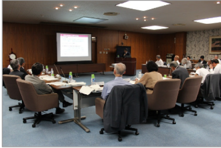
図7 組織評価のヒアリング

大学運営においては、学長の行動指針として数値目標や具体的事項を盛り込んだ「Annual Plan2014」の策定や経営協議会の学外委員が評価者として各部署のヒアリングを行うとともに、評価結果に応じて部局にインセンティブ経費を配分する本学独自の組織評価の実施（図7）を通じて、教育研究の質の向上及び運営の活性化を図った。また、IR（インスティテューショナル・リサーチ）機能を有する「総合的学情データ分析システム」に蓄積した各種情報及び分析結果等を大学経営の基礎情報や入試広報に活用するなどし、その一環として企画した本学で学ぶ魅力をPRする一般入試募集広告が第5回「山形広告賞」最優秀賞を受賞した（図8）。