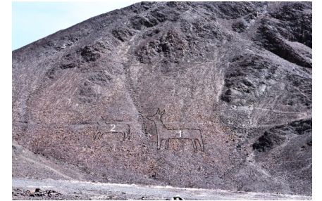
図4 発見したリャマの地上絵

社会貢献については、東北創生研究所を中心に上山市、戸沢村及び真室川町の各モデル地域に対する活性化事業の展開や地域振興において中核的な役割を担う観光業の若手経営者を対象とした「次世代観光経営者育成プログラム」を提供するほか、平成25年度採択の「地（知）の拠点整備事業」（COC）を通じて地域の課題を解決するための研究を積極的に推進し、「社会創生研究部門」「産業構造研究部門」「食料生産研究部門」の3部門が連携したプロジェクト研究を開始した（図5）。また、附属病院においては、入院時の患者に対して各病棟スタッフとの連携を図りながら、総合的かつ一元的なサービスを提供することを目的として、国立大学病院では初めてとなる「医療コンシェルジュステーション」を平成27年1月に設置するなどした（図6）。