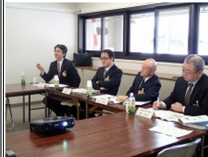
図5 真室川町でのCOC推進委員会

社会貢献については、東北創生研究所を中心に上山市、戸沢村及び真室川町の各モデル地域に対する活性化事業の展開や地域振興において中核的な役割を担う観光業の若手経営者を対象とした「次世代観光経営者育成プログラム」を提供するほか、平成25年度採択の「地（知）の拠点整備事業」（COC）を通じて地域の課題を解決するための研究を積極的に推進し、「社会創生研究部門」「産業構造研究部門」「食料生産研究部門」の3部門が連携したプロジェクト研究を開始した（図5）。また、附属病院においては、入院時の患者に対して各病棟スタッフとの連携を図りながら、総合的かつ一元的なサービスを提供することを目的として、国立大学病院では初めてとなる「医療コンシェルジュステーション」を平成27年1月に設置するなどした（図6）。