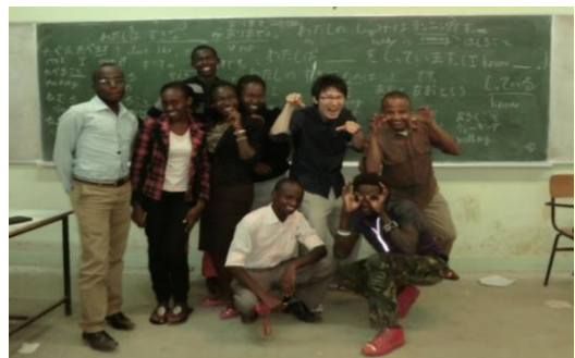
ジョモケニヤッタ農工大学にて