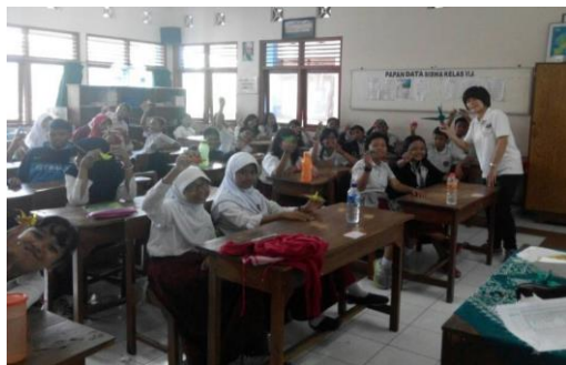
ガジャマダ大学にて