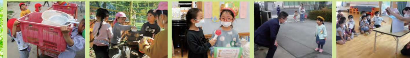
あ)と片付けをしっかりとする子ども、い)ろんなことに挑戦する子ども、う)つくしい言葉を使う子ども、え)がおであいさつする子ども、お)話をよく聞く、本をよく読む子ども