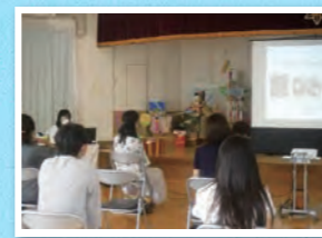
げんきくらぶ (保護者対象の食育講演会)