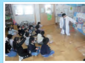
げんきくらぶ (食育指導)