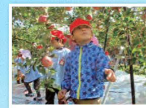
地域との連携 (りんご農園見学)