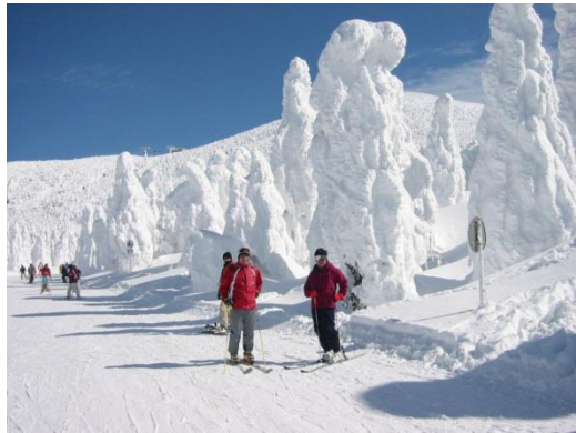
snow monsters in Zao