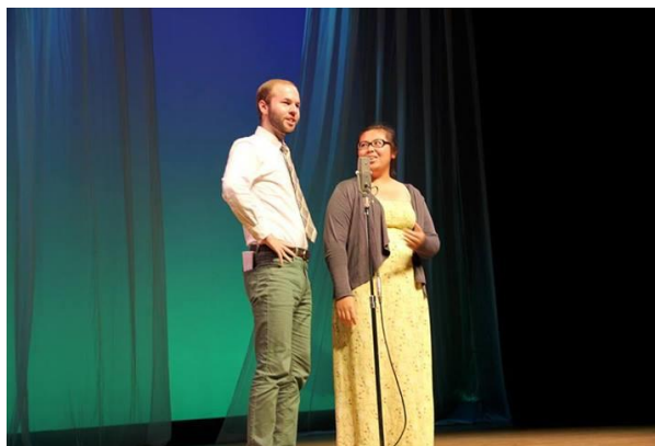
漫才(地域の国際芸能祭で)