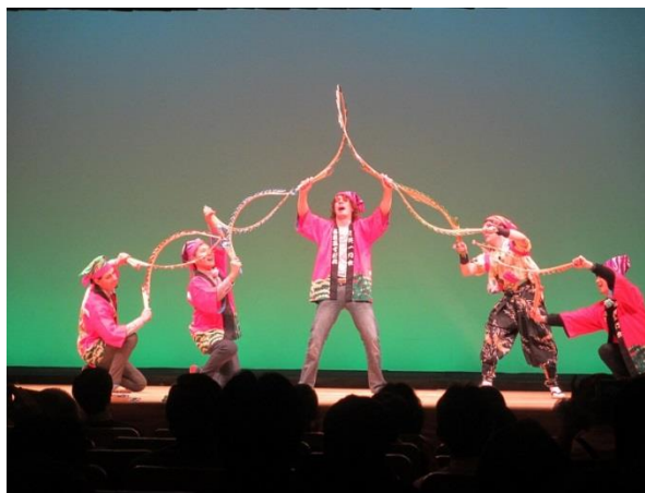
南京玉すだれ(多文化交流コンサート)