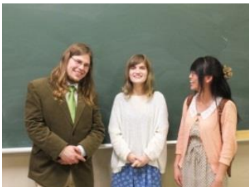
先輩日研生が講演に来訪