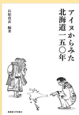
①『アイヌからみた 北海道一五〇年』 石原真衣編著 北海道大学出版会 (1,760 円)