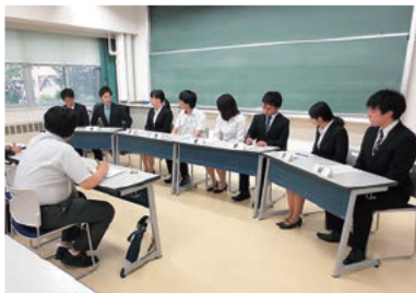
教員採用試験面接セミナーの様子

本学部の就職支援専門委員会と小白川キャンパス事務部学生・キャリア支援課就職担当が連携し、様々な就職支援事業を行っています。