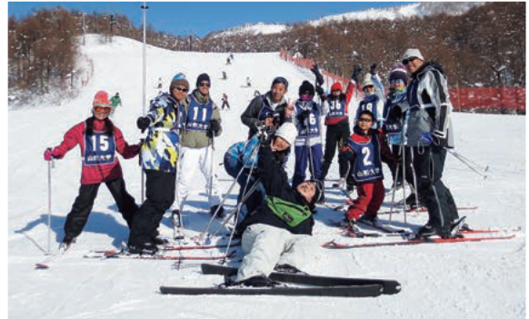
日本・台湾師範大学の学生によるスポーツ交流プログラム(山形市蔵王)