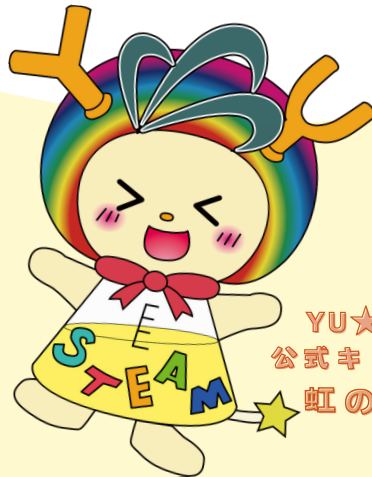
YU★STEAM 公式キャラクター 虹のワック