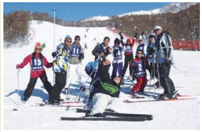
日本・台湾師範大学の大学生によるスポーツ交流プログラム(山形市蔵王)