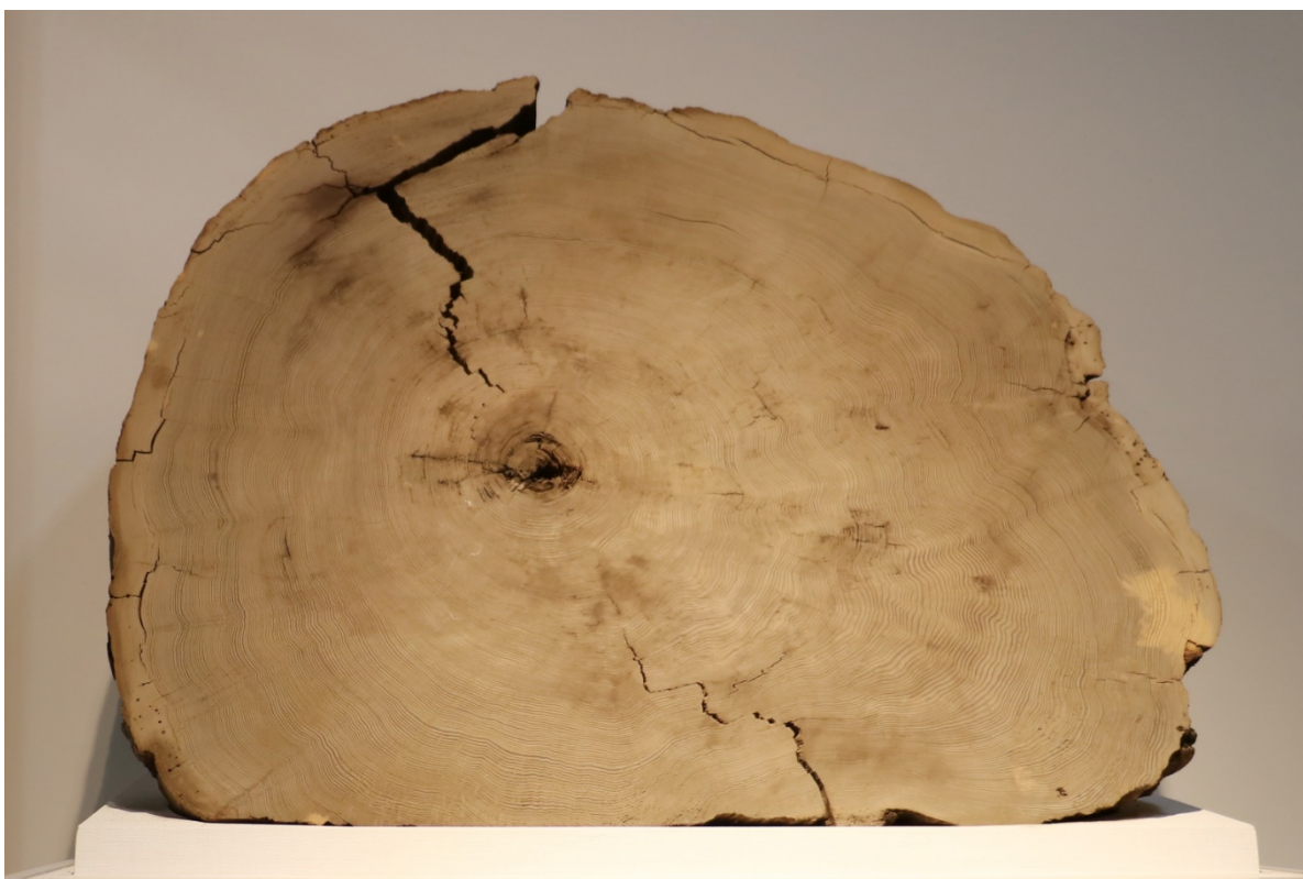
図 1：分析に用いたものと同じ個体の鳥海神代杉（山形大学附属博物館所蔵）。紀元前 466 年に噴火した鳥海山の山体崩壊により埋没した個体を入手した。1 年輪の幅は典型的に 3-5mm と比較的厚く、早材・晩材の剥離が可能となった。

宇宙線生成核種の測定分析から見つけている西暦 775 年、西暦 994 年、紀元前 660 年頃の 3 つの太陽面爆発が仮に現在発生すると、人工衛星の故障や通信障害など、現代社会へ甚大な被害が及ぶと考えられています。今回の研究は、そのような太陽面爆発が数年にわたって立て続けに発生した可能性を示すものです。今後、南極氷床コアのベリリウム 10 分析などから、紀元前 660 年頃のイベントについて、さらに詳しい情報がもたらされることが期待されます。