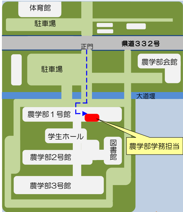
◎鶴岡キャンパス(鶴岡市若葉町1-23)