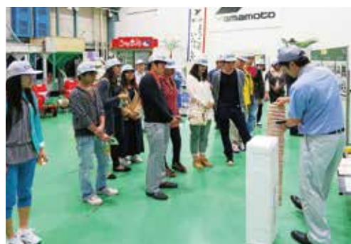
工場見学 Visiting a factory