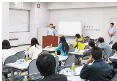
OBによる就職体験談 A graduate relating his job-seeking experience

There is a program that runs with the cooperation of the Yamagata Prefectural Government whereby students can visit companies in the prefecture. Under this program, international students can get to know about Japanese companies and receive information concerning employment in Japan from graduates of the university working at the companies.