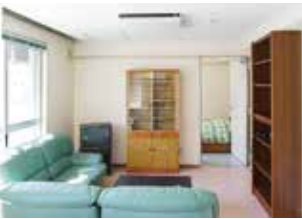
家族室(留学生用) Rooms for a family