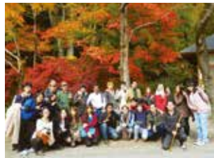
国際交流サークル I F Cultural Exchange Club "IF"

There are many sports and cultural clubs including the Hanagasa dancing club.