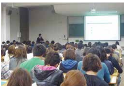
進路・就職ガイダンス Employment guidance