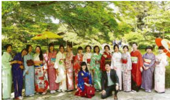
日本文化入門 An Introduction to Japanese Culture

We aim for an improvement in the Japanese language ability of our international students by providing Japanese language education for our international students. The target of this assistance is the international students, including undergraduates, international exchange students, or graduate research students who require Japanese language studies for their everyday life activities or with their university classes or research. Japanese culture classes are available as well for international exchange students.