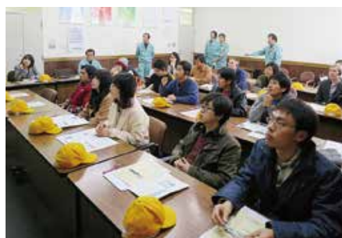
企業による会社概要説明 An information session by a company