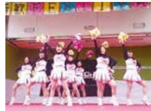
チアダンスサークル Cherries Cheerleading Club "Cherries"