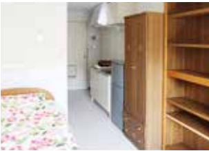
単身室(留学生用) Rooms for a single person (for international students)