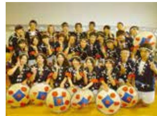
花笠サークル四面楚歌 Hanagasa Dance Club "Shimensoka"