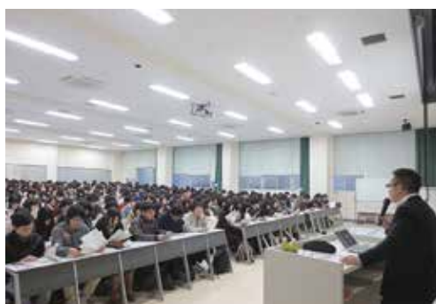
就職セミナー Employment seminars