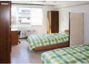
夫婦室(留学生用) Rooms for a married couple