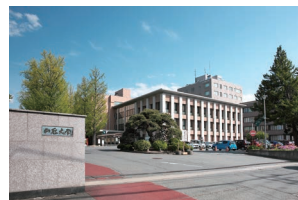
小白川キャンパス

観光の“これから”を育てる勉強会は、 山形大学小白川キャンパス内での開講 を予定しております。