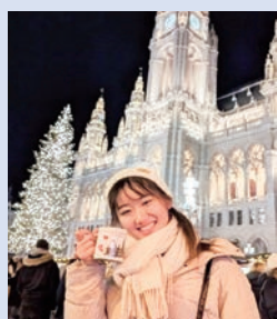
クリスマスマーケットにて