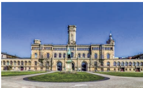
ライプニッツ・ハノーヴァー大学 (ドイツ)