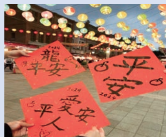
友人と行った春聯制作体験

私は第二外国語力の向上や異文化を体感することで、自身の視野を広げたいと思い、短期派遣留学プログラムに参加しました。留学先の台湾師範大学では、年代国籍問わず多くの学生が集まり一緒に授業を受けるので、活発に異文化交流をすることができました。中国語を熱心に学ぶ学生が多く、彼らと積極的に交流し、共に成長できたことは、今しかできない体験だったと感じています。ぜひ皆さんにも留学での生活や授業を通して、多くの人や文化に触れてほしいと思います。きっと新たな発見や出会いが見つかるはずです！