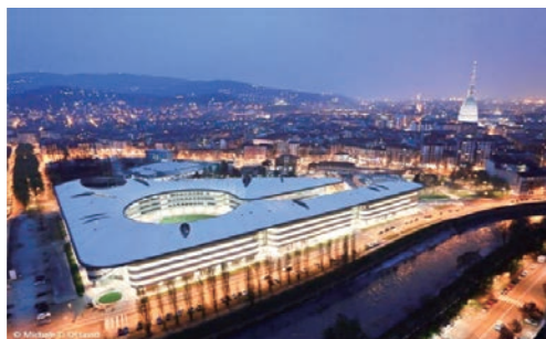
トリノ大学 (イタリア)

大学院農学研究科ダブルディグリープログラム情報 (QRコードからお進みください)