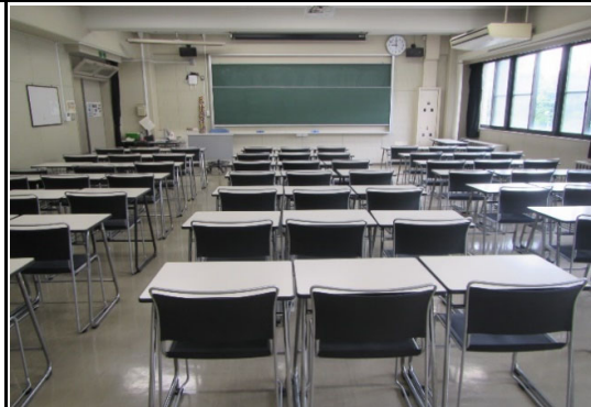
2階 看護学科第二講義室