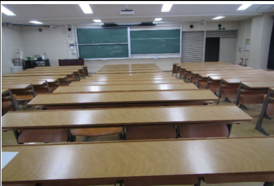
1階 看護学科第一講義室