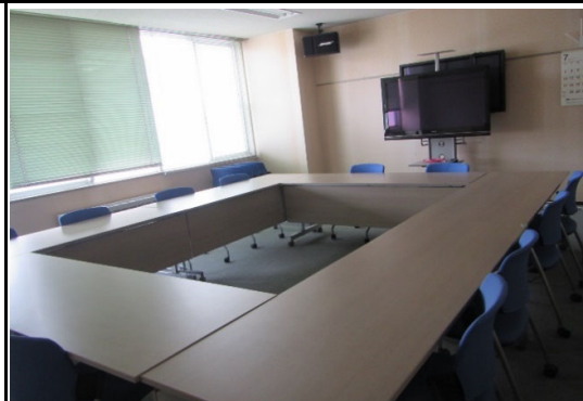
2階 管理棟第二会議室