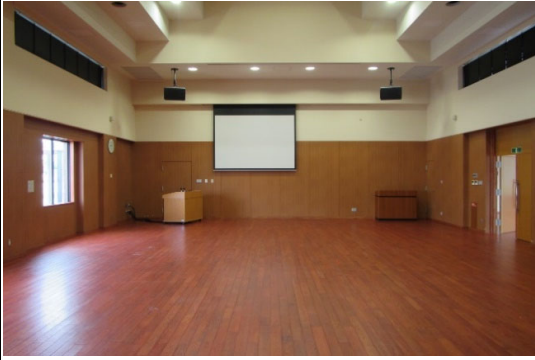
山形医学交流会館ホール