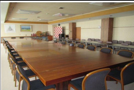
2階 管理棟第一会議室