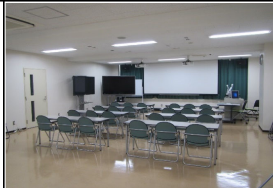
2階 研究室2 (多目的)