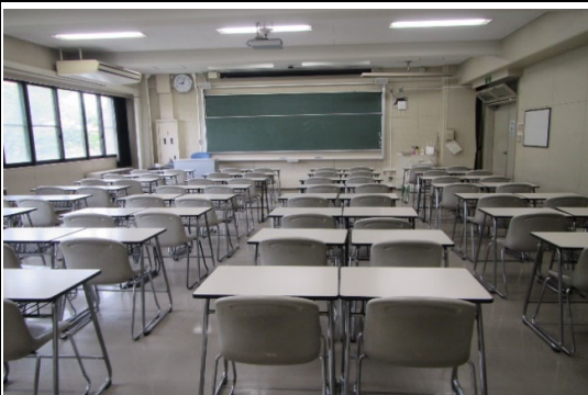
2階 看護学科第三講義室