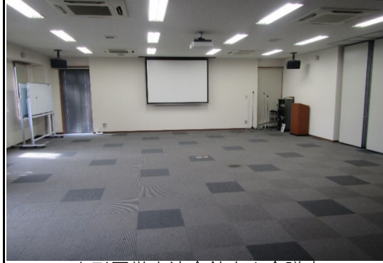
山形医学交流会館大小会議室