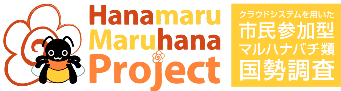
図2: ウェブページで市民に呼びかけるマスコットキャラクターのはなまるちゃんとロゴ ウェブページ: http://meme.biology.tohoku.ac.jp/bumblebee/index.html フェイスブック: https://www.facebook.com/hanamarumaruhana/ ツイッター: https://twitter.com/Hanamaruchan870

東北大学大学院生命科学研究科の大野ゆかり研究員、河田雅圭教授、中静透教授、山形大学学術研究院の横山潤教授は、ウェブページやフェイスブック、ツイッターで市民に呼びかけ(図2)、市民が撮影したマルハナバチ類の写真をメールで収集し、三年間で4,000枚を超える写真を収集しました。