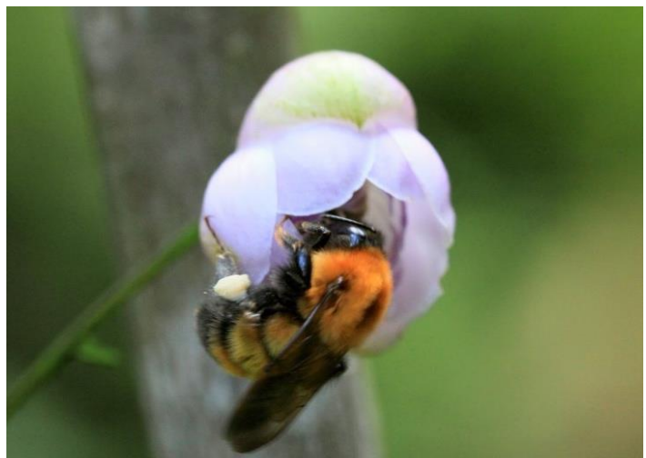
図1：マルハナバチ類の1種のトラマルハナバチ

マルハナバチ類は野生植物や農産物の重要な送粉者ですが、世界的に減少傾向にあると言われていています。国際自然保護連合（IUCN）は、2011年からレッドリスト作成を開始し、2015年にはヨーロッパで1/3の種が、アメリカでは1/4の種が減少傾向にあると報告しました。マルハナバチ類の全世界レベルの早急な分布調査と保全対策の立案が望まれています。