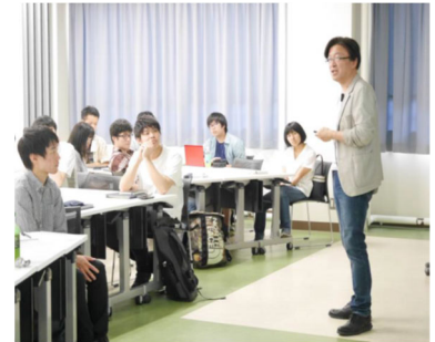
アントレプレナーシップの教育風景 2019年度EDGE-NEXTプログラムから