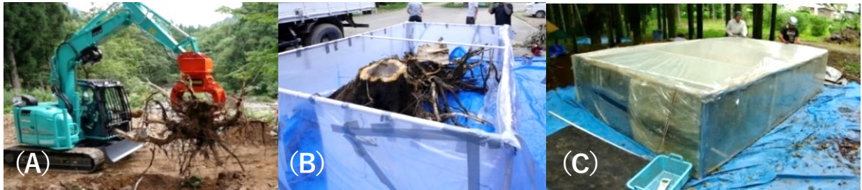
図1. (A) 根全体を重機と人手で徹底的に採取、(B) 全ての根を測定装置に入れる、(C) 密閉後の呼吸測定 芽生え～成木に対応した大小10個の装置を作成し、内部に材料を密閉しCO 2 濃度上昇を直接測定することで呼吸を評価します。再現性は高く、正確な測定ができます。測定は夏に行い、呼吸は同じ温度条件で比較します。

森林育成には根を育てることが経験的に重要とされていますが、これを説明する理論はありませんでした。本研究結果は、根に着目した新たな樹木成長理論の可能性を示します。さらに、これまで成長メカニズムは主に地上部から検討されてきました。しかし、樹木の成長や適応進化は葉1枚の生理学的適応ではなく、根を含む個体全体の水と炭素の獲得で決まります。この点で、光合成を支える根の役割を個体全体でモデル化したことは、従来の森林研究、育成技術に「根が制御する成長」の新視点を加え、カーボンニュートラルに果たす森林の根の育成の重要性を示す成果と言えるでしょう。