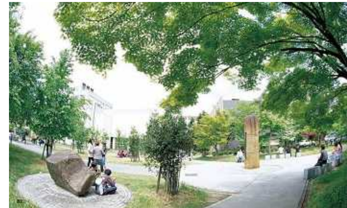
山形大学キャンパス