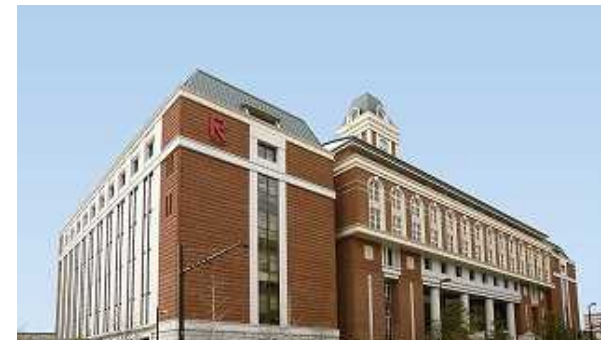
立命館朱雀キャンパス