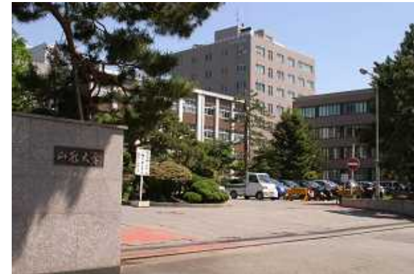
山形大学キャンパス