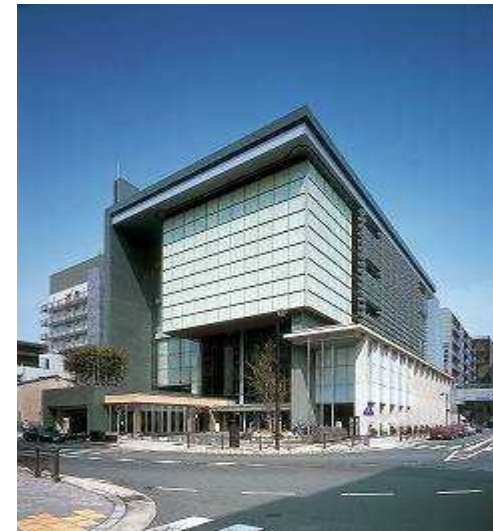
キャンパスプラザ京都 (大学コンソーシアム京都)