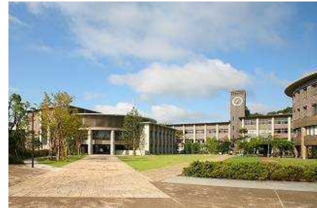
立命館大学衣笠キャンパス