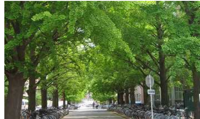
山形大学キャンパス