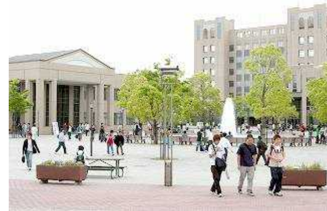
立命館大学びわこ・くさつキャンパス