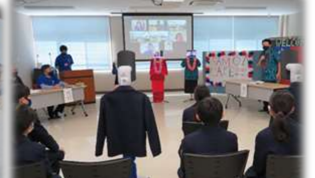
山形市と協働した「サモア・カフェ」開催