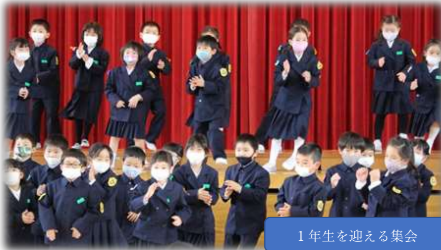
1年生を迎える集会