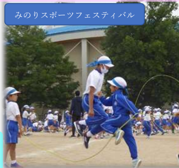
みのりスポーツフェスティバル