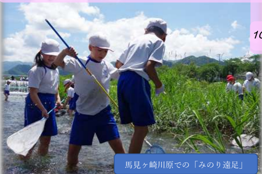
馬見ヶ崎川原での「みのり遠足」