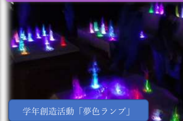
学年創造活動「夢色ランプ」

合唱部や弦楽部の活動等を通して、音楽や芸術に親しむ心・美しさを感じる心を育みます。