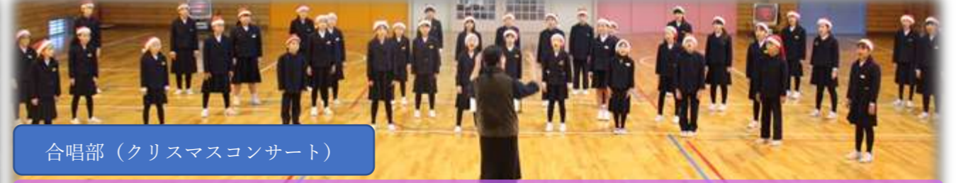
合唱部（クリスマスコンサート）

合唱部や弦楽部の活動等を通して、音楽や芸術に親しむ心・美しさを感じる心を育みます。