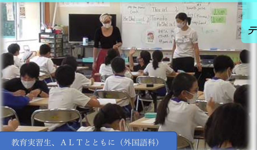
教育実習生、ALTとともに（外国語科）

子どもたちの豊かで多様な学びを支える「附属学校園コミュニティ・スクール」の実現に向け、ネットワークの構築を進めます。