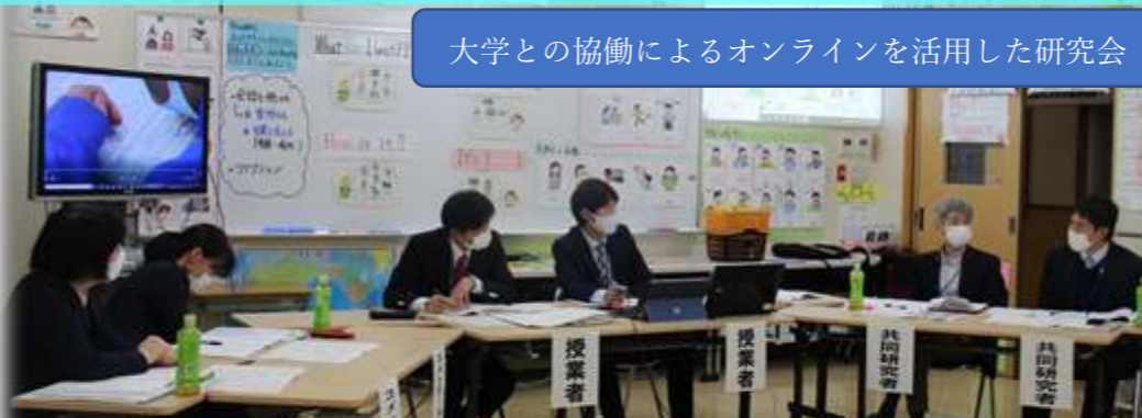
大学との協働によるオンラインを活用した研究会

子どもたちの豊かで多様な学びを支える「附属学校園コミュニティ・スクール」の実現に向け、ネットワークの構築を進めます。