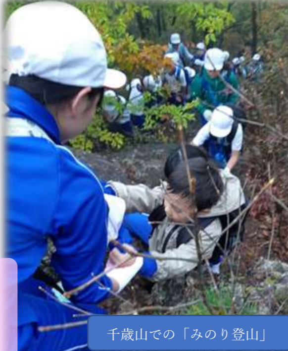
千歳山での「みのり登山」