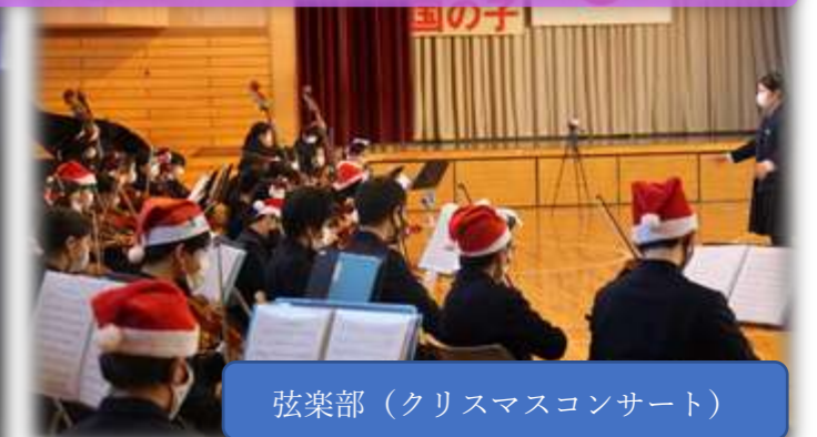
弦楽部（クリスマスコンサート）